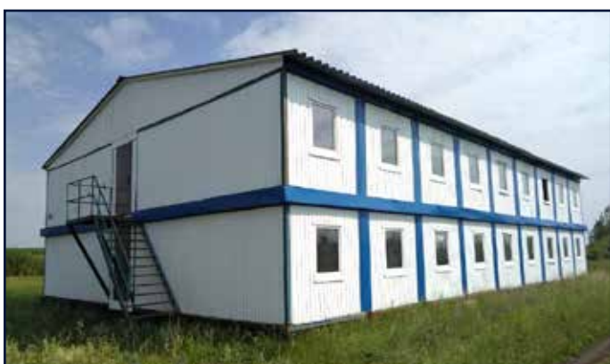
Общежитие для сотрудников