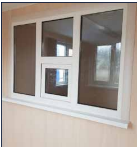
Модульное здание, общим размером 31200x14000x2500